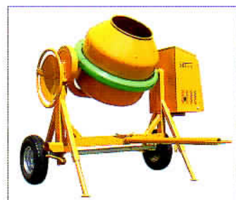
MOD. S 360 TIPO S 210 F