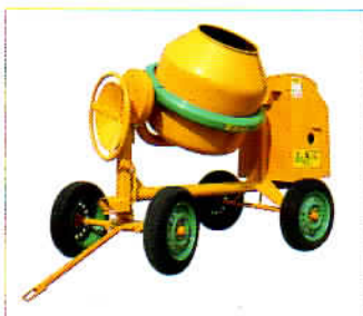
MOD. S 360 TIPO S 85 A