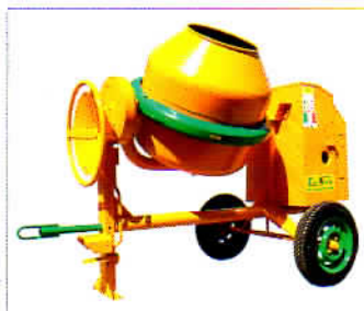
MOD. S 360 TIPO S 75 E