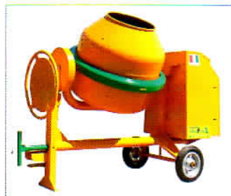
MOD. S 360 TIPO S 75 I